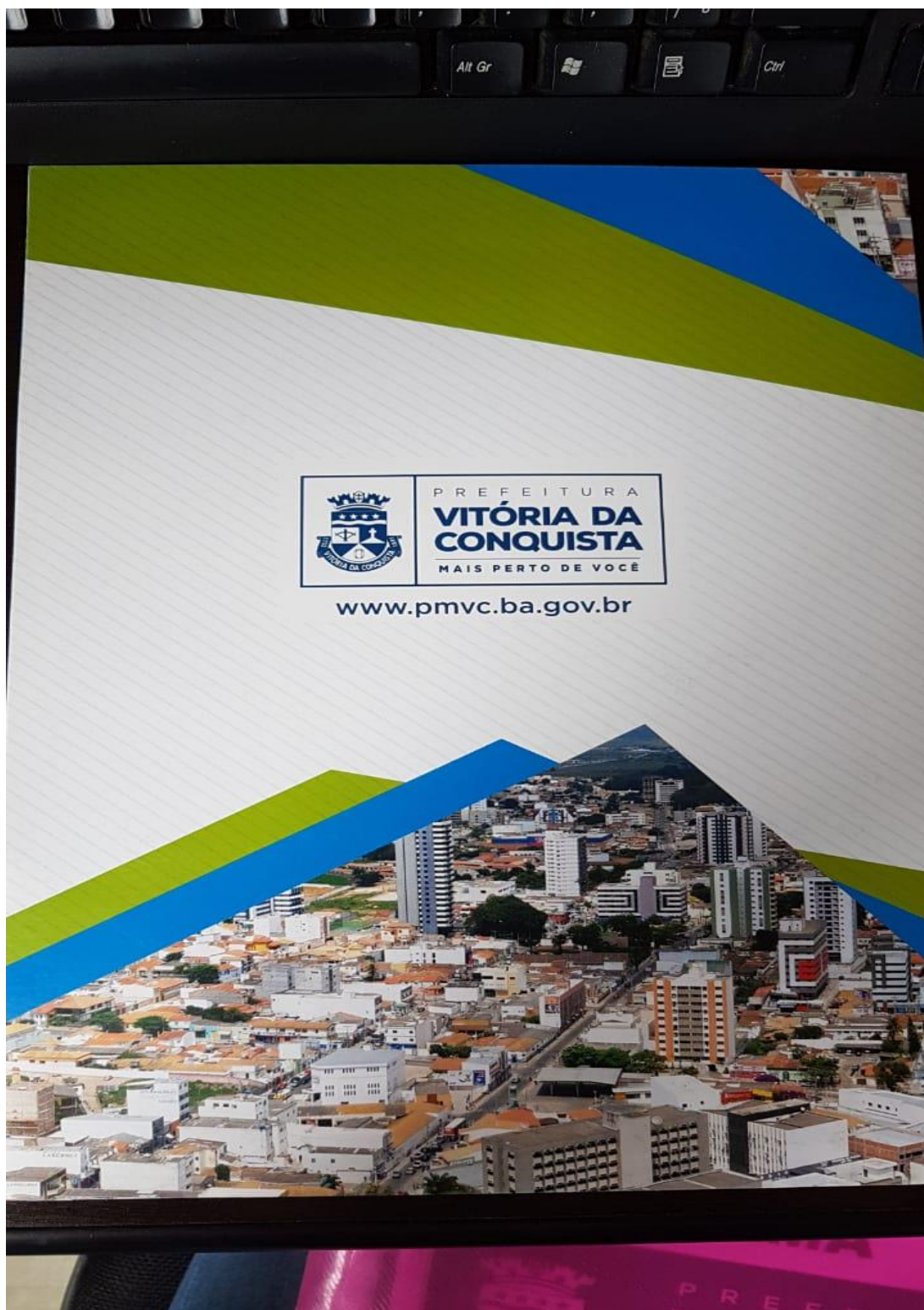
Figura 3: Capa de fundo