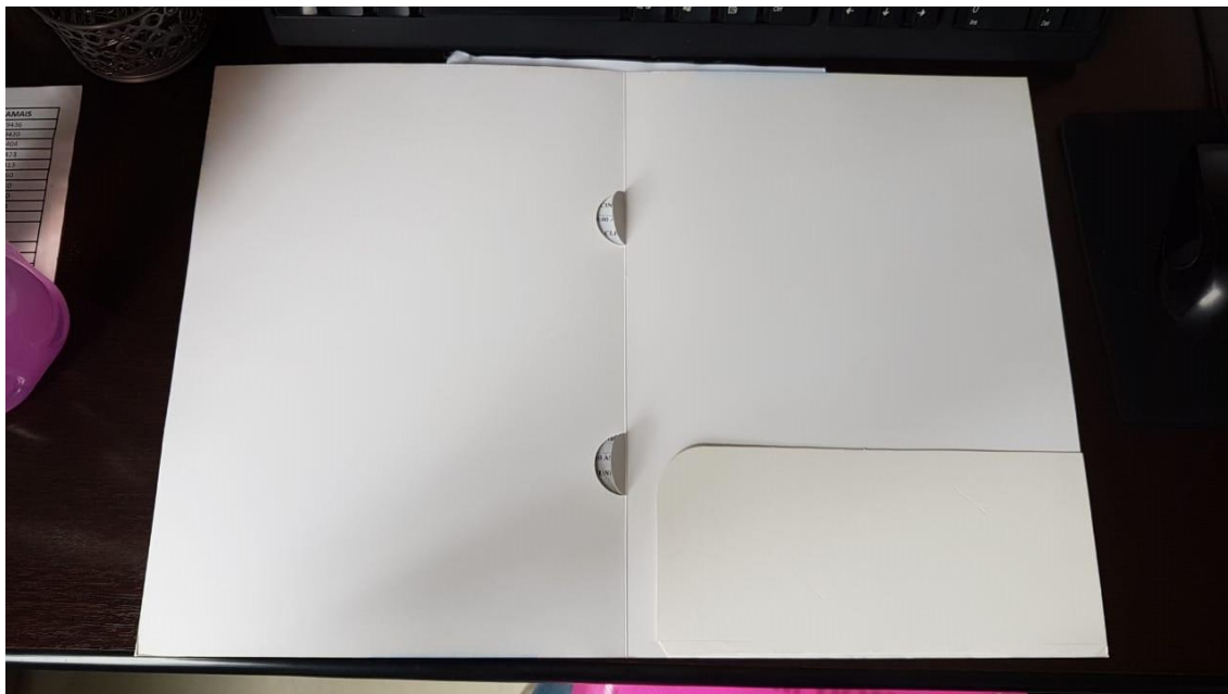
Figura 2: Parte Interna da pasta aberta

Lapela dobrada para encaixe de folhas de papel, blocos de anotações, etc